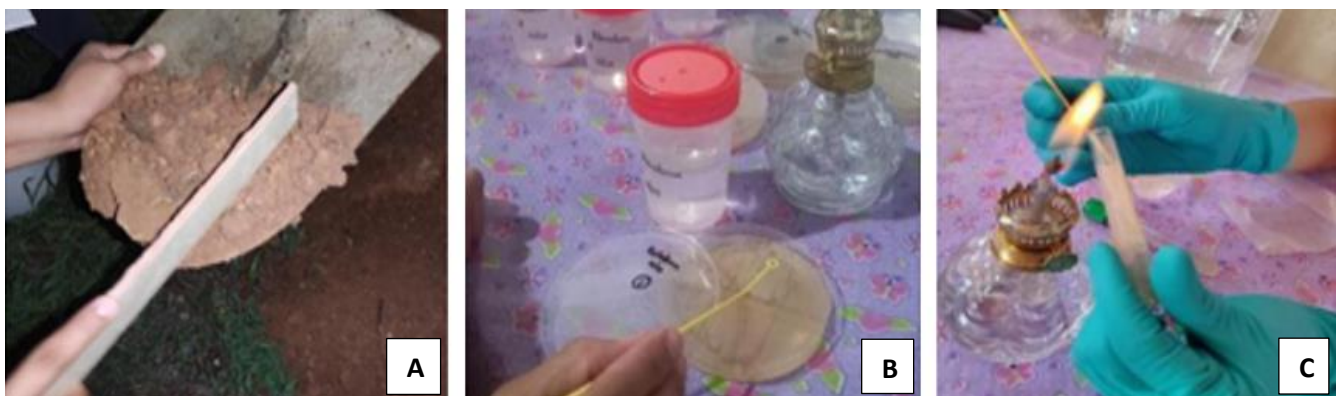
Figura 1. Proceso metodológico para el estudio microbiológico del suelo: (A) recolección de muestras, (B) siembra de microorganismos y (C) preparación de tratamientos en condiciones estériles.

La Figura 1 presenta tres paneles relacionados con el proceso científico de manejo de muestras. Este procedimiento se ha replicado siguiendo protocolos estándar descritos en la literatura científica vigente para garantizar la reproducibilidad y fiabilidad de los resultados obtenidos.