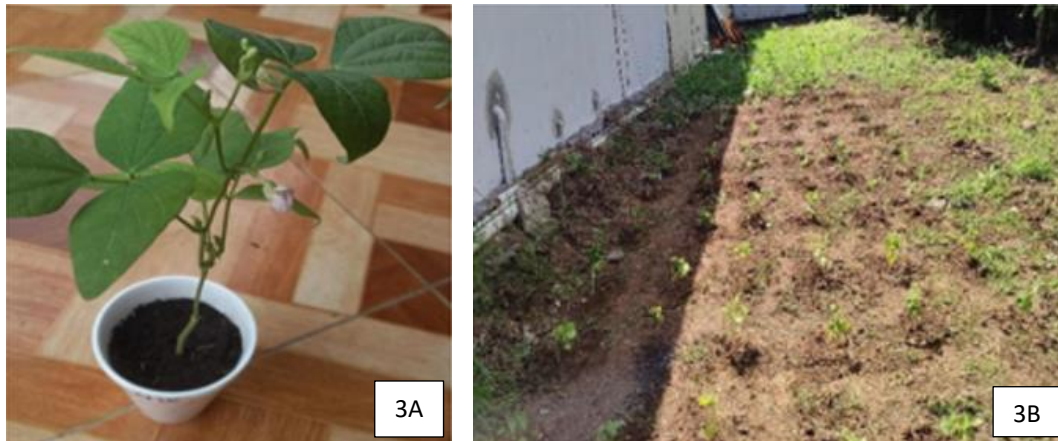
Figura 3. Etapas finales del proceso experimental con Phaseolus vulgaris . (3A) floración de Phaseolus vulgaris con la aplicación del mix de microorganismos y (3B) trasplante a parcelas de Phaseolus vulgaris .

En la Figura 3, se muestra las etapas finales del proceso experimental con Phaseolus vulgaris comúnmente conocida como frijol., donde se observa la floración de una planta tratada con la mezcla de microorganismos y el trasplante de las plántulas a parcelas experimentales para evaluar su crecimiento en condiciones más cercanas a las del campo.