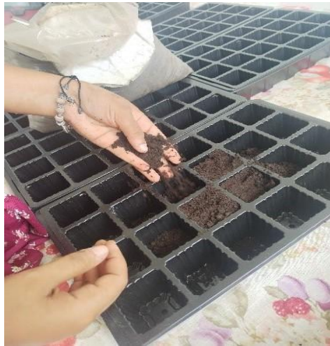
Figura 2. Siembra de semillas de Phaseolus vulgaris .

Después de 15 días de la etapa experimental en invernadero, se seleccionaron 8 plantas de cada tratamiento, incluyendo el control, para su trasplante al campo. Se preparó una parcela de 1 x 1,5 metros, arando el suelo para asegurar condiciones óptimas de crecimiento. Las plantas seleccionadas se trasplantaron a esta área para observar su desarrollo en condiciones de campo (Chirino-Valle et al., 2016) (Figura 3)