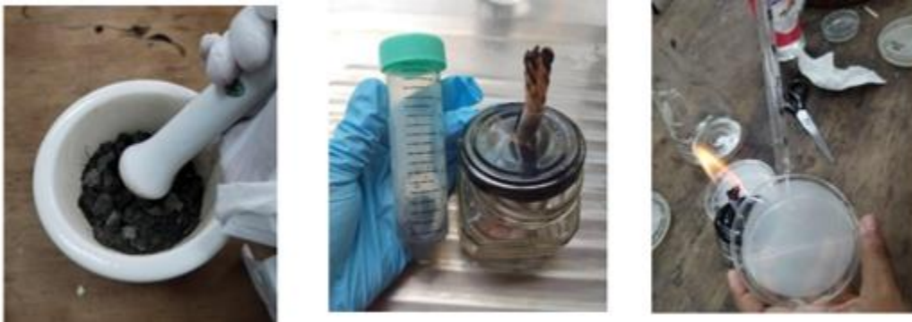
Figura 1. Aislamiento de microorganismos a partir del lodo activado de la PTAR.

Los lodos se recolectaron de la planta de tratamiento de aguas residuales (PTAR) y se procesaron para aislar microorganismos beneficiosos. Se maceró 1 g de lodo y se diluyó en agua destilada estéril, realizando diluciones seriadas. Estas diluciones se sembraron en Se utilizaron medios de cultivo selectivos para el aislamiento y crecimiento de cada microorganismo: Agar Cetrimide para Pseudomonas sp., Agar Papa Dextrosa (PDA) para Trichoderma sp., y Agar Extracto de Levadura Manitol (YMA) para Rhizobium sp. (Figura 1).