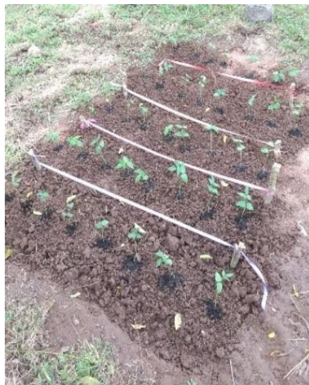
Figura 3. Plantas de Phaseolus vulgaris en terreno.

Después de 15 días de la etapa experimental en invernadero, se seleccionaron 8 plantas de cada tratamiento, incluyendo el control, para su trasplante al campo. Se preparó una parcela de 1 x 1,5 metros, arando el suelo para asegurar condiciones óptimas de crecimiento. Las plantas seleccionadas se trasplantaron a esta área para observar su desarrollo en condiciones de campo (Chirino-Valle et al., 2016) (Figura 3)